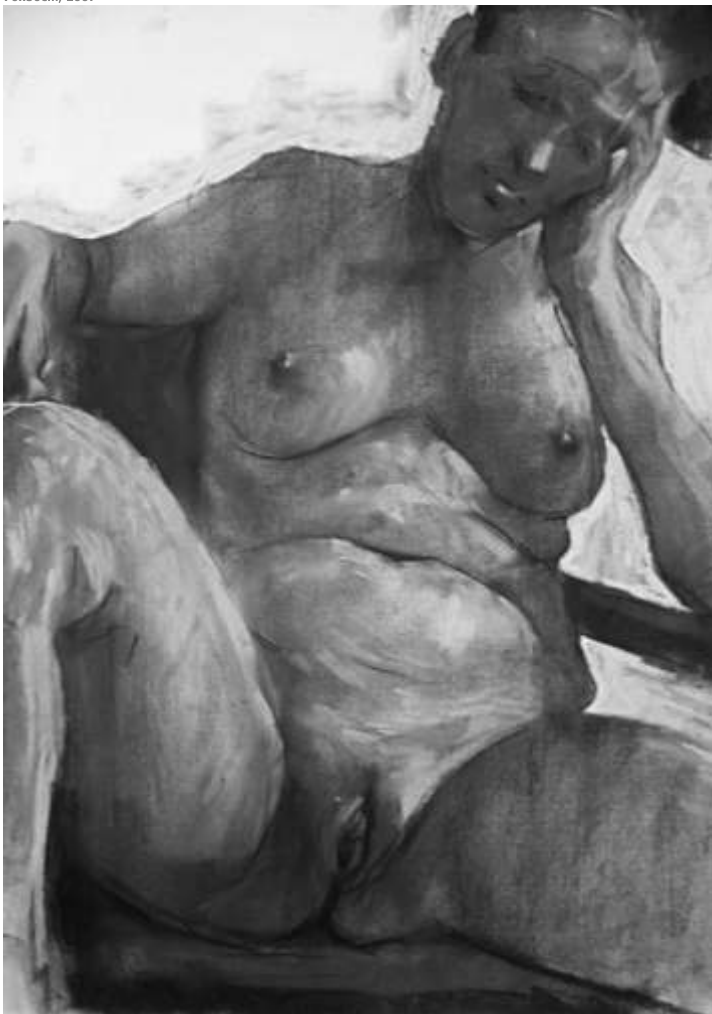
Radu SOLOVĂSTRU MYSOGIN CLUB 1 cărbune, pastel pe hârtie szén, pasztell, papír charcoal, pastel on paper 70x50cm, 2007