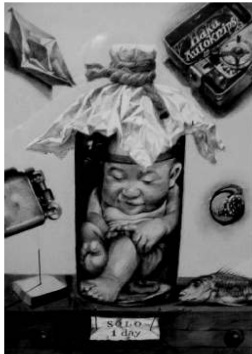
Radu SOLOVĂSTRU lucrări grafice | grafikák | graphics