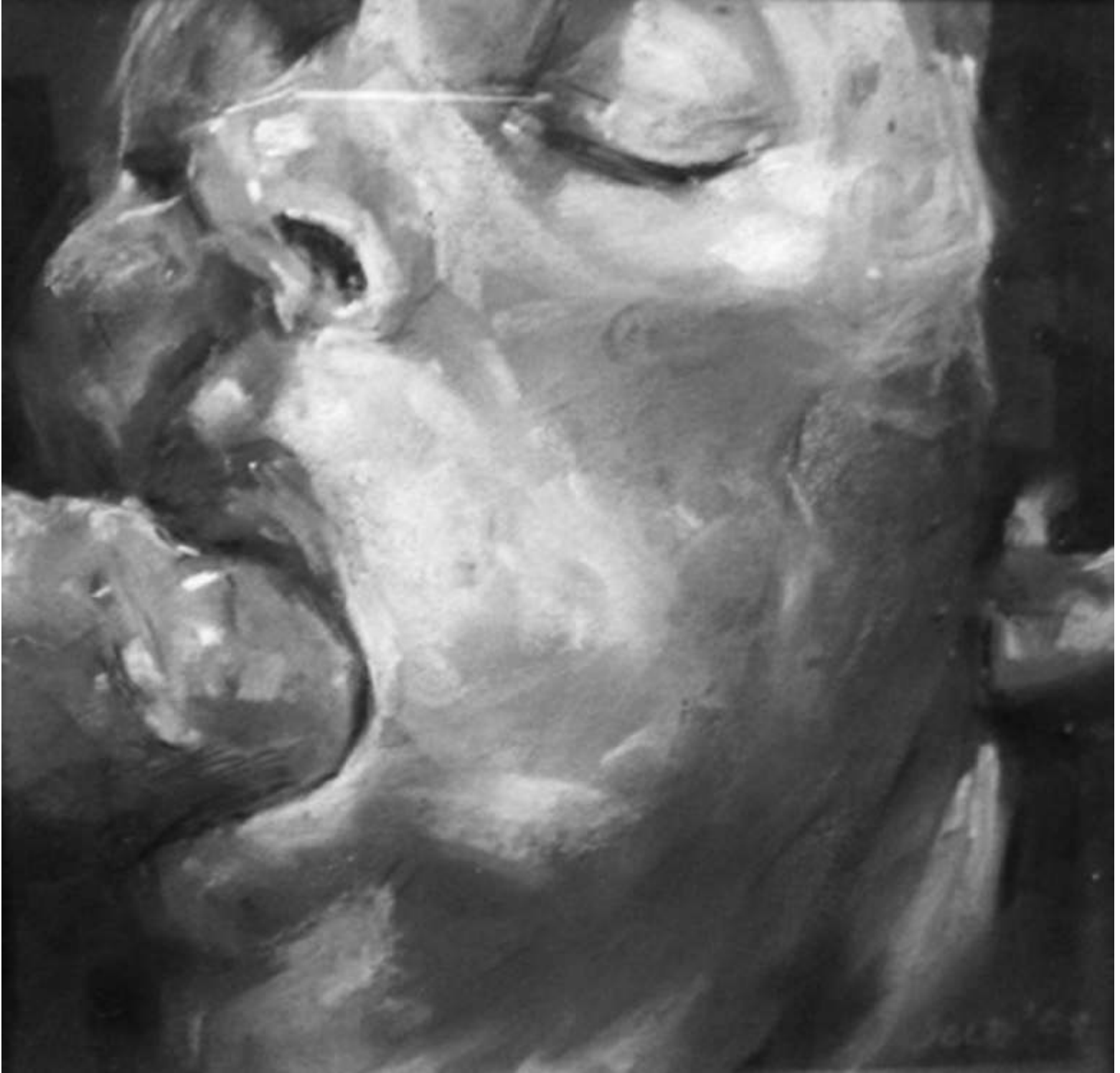
Radu SOLOVÁSTRU MYSOGIN CLUB 3 (detaliu | részlet | detail) cărbune, pastel pe hârtie szén, pasztell, papír charcoal, pastel on paper 70x50cm, 2007