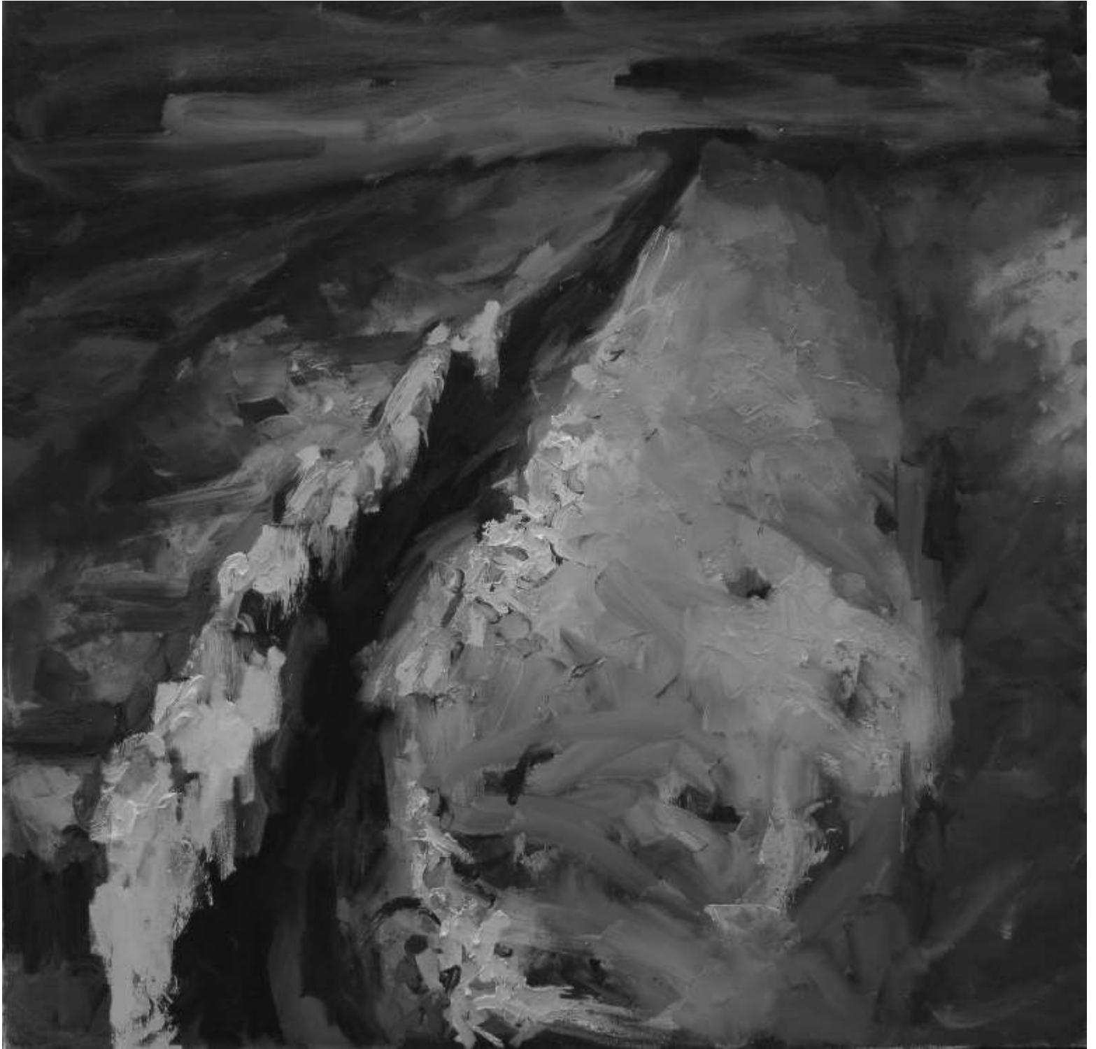
Dan MĂCIUCĂ EARTH CRACK ulei pe pânză olaj, vászon oil on canvas 150x120, 2008