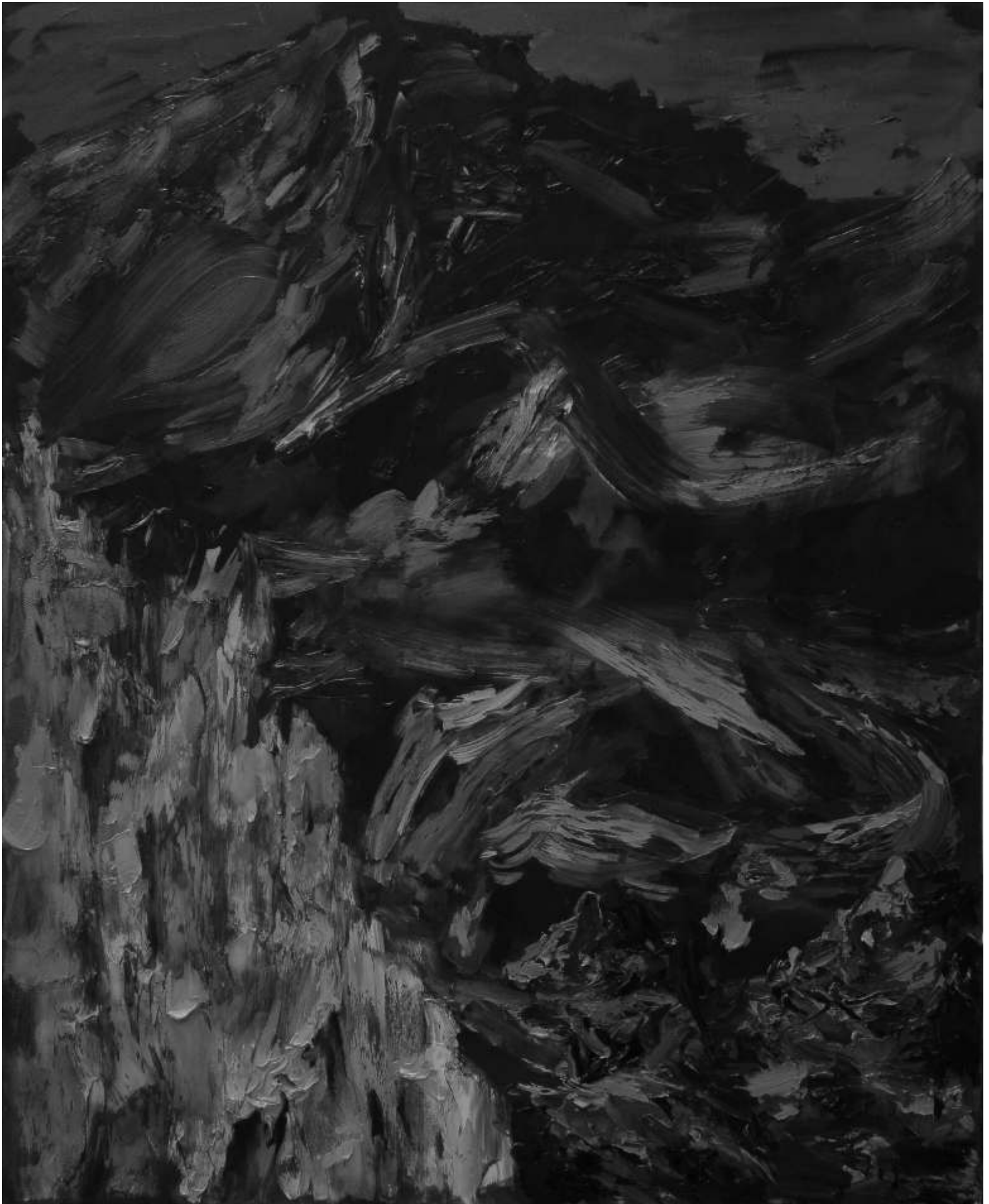
Dan MĂCIUCĂ UNTITLED 1 (from Climatic Cynicism series) ulei pe pânză oil on canvas 150x120, 2008