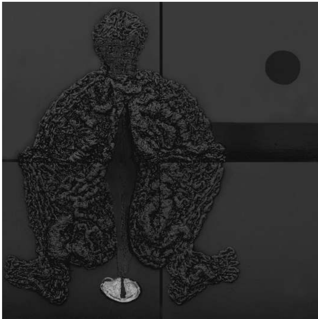
BERSZÁN Zsolt BLACK RELIEF 2 spumă poliuretanică, ulei, acrilic, silicon negru, silicon transparent, furtun transparent, apă colorată în negru, pânză, suport PFL poliuretán hab, olaj, akril, fekete szilikon, átlátszó szilikon, átlátszó gumicső, feketére festett víz, préselt lemez, vászon polyurethane foam, oil, acrylic, black silicon, transparent silicon, transparent pipe, black colored water, canvas, fibreboard 200x200cm, 2008

nyos fokú illúziót kínál, a valóság egyfajta fekete birtoklását. Berszán Zsolt nem nyújt semmilyen részletet a szubjektum intimitásáról. A velejő feszültségek és ellentmondások közvetlenül a használt anyagok milyenségéből fakadnak. Van egy pillanat, amikor a rajz és a fekete kompozíció azzá válik, aminek lennie kell. A misztikum módszeresen épül ki. Semmi nem marad homályban. A vonal anatómiája és a konceptuális kapcsolat a fekete anyagokkal a kísérlet furcsa szabadságát eredményezi egyfajta ellenőrzött módon. Semmi nem didaktikus, nem illusztratív vagy szimbolikus. Berszán Zsolt mindent megváltoztat, kutat és tudatosan irányít a kísérletnek ebbe a furcsa szabadságába.