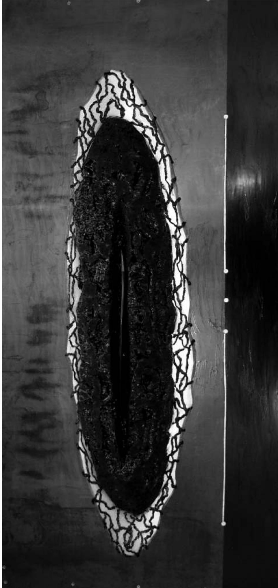
BERSZÁN Zsolt BLACK FLUID TRANSFUSION 3 - REPLACES SERIES spumă poliuretanică, ulei, acrilic, silicon negru, furtun transparent, ulei de motor, placă metalică de 4mm polyurethane foam, oil, acrylic, black silicon, transparent pipe, motor oil, sheet metal 4mm 200x100cm, 2008