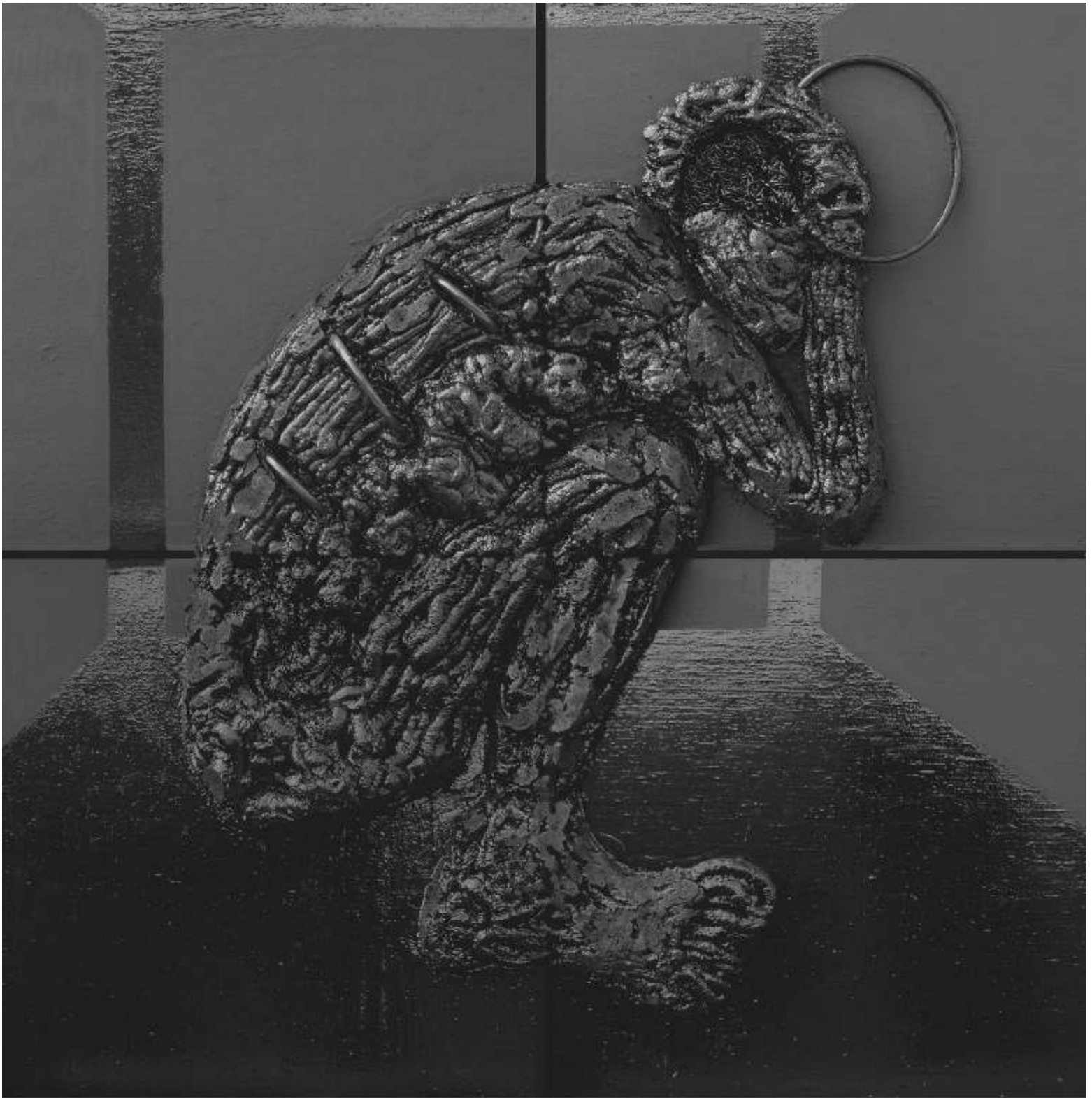
BERSZÁN Zsolt BLACK RELIEF 3 spumă poliuretanică, ulei, acrilic, silicon negru, furtun transparent, apă vopsită în negru, pânză, suport PFL polyurethane foam, oil, acrylic, black silicon, transparent pipe, black colored water, canvas, fibreboard 200x200cm, 2008